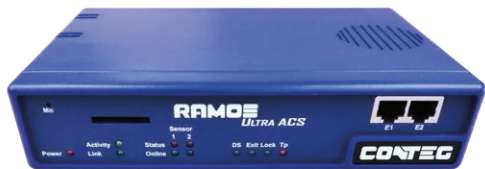
RAMOS Ultra ACS

Inteligentní monitorovací systém RAMOS slouží ke kontrole stavu vnitřního a vnějšího prostředí, jako například teploty, vlhkosti, úniku vody, kouře, ve velkých datových centrech, serverovnách nebo jednotlivých rozvaděčích. RAMOS lze navíc použít pro řízení přístupu.